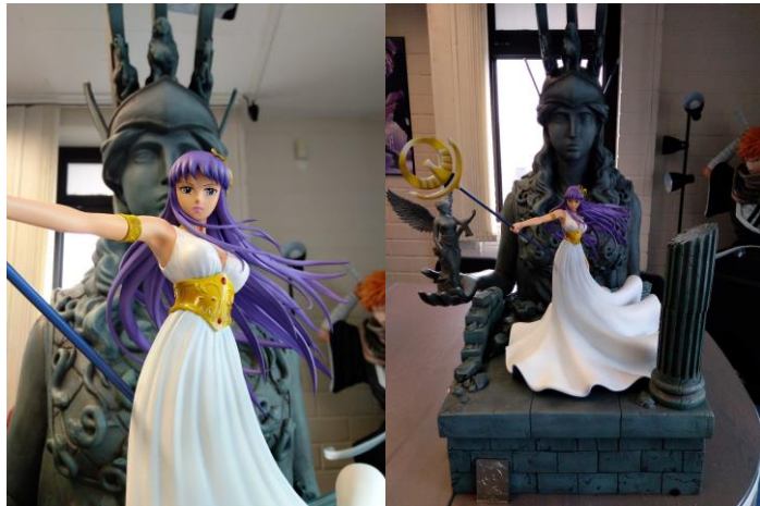
“Athena HQS+” by TSUME, 2020 (SAINT SEIYA)