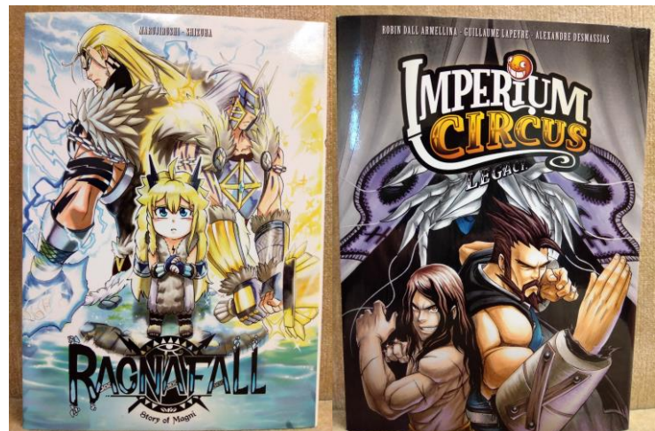
Couvertures des Mangas by TSUME « Ragnafall » et « Imperium Circus » (2018)

Comme nous a confirmé le CEO, Tsume veut s’orienter vers l’animation, adapter les personnages et aussi avoir sa propre série sur Netflix. De plus, Tsume souhaite également par la suite développer des jeux vidéo. 3