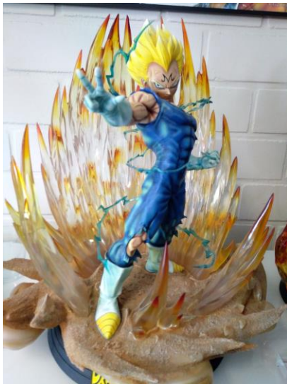
"Majin Vegeta HQS+" by TSUME, 2018 (DRAGON BALL Z)

Après plusieurs années, Tsume a gagné la confiance de certaines des principales sociétés du monde du manga et de l'anime, comme Shueisha, Toei Animation, TV Tokyo ou Kodansha. De même Tsume organise des événements à Mondorf-les-Bains et a fréquemment des invites très importants du Japon, qui sont aussi présents, pendant ces jours-là.