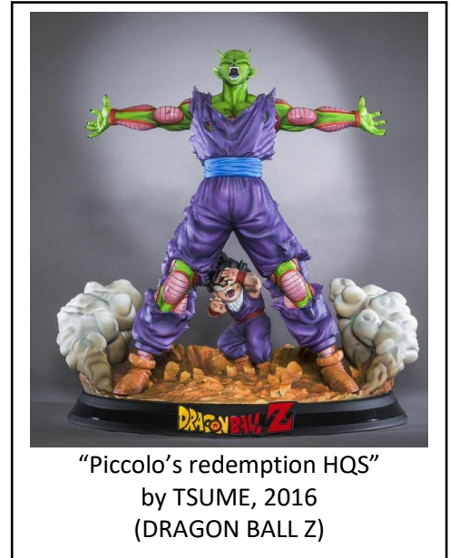
"Piccolo's redemption HQS" by TSUME, 2016 (DRAGON BALL Z)

Tsume SA a été créée au Luxembourg en 2010. Au fil des années, l'entreprise a réussi à s'établir sur le marché des statuettes de collection. Grâce à la collaboration avec des licences japonaises renommées, Tsume a donné naissance à un panel de personnages destinés aux collectionneurs exigeants. C'est important de noter cela, parce que sans les licences officielles, il est impossible de vendre légalement des statues ou figurines des mangas ou animes. 1